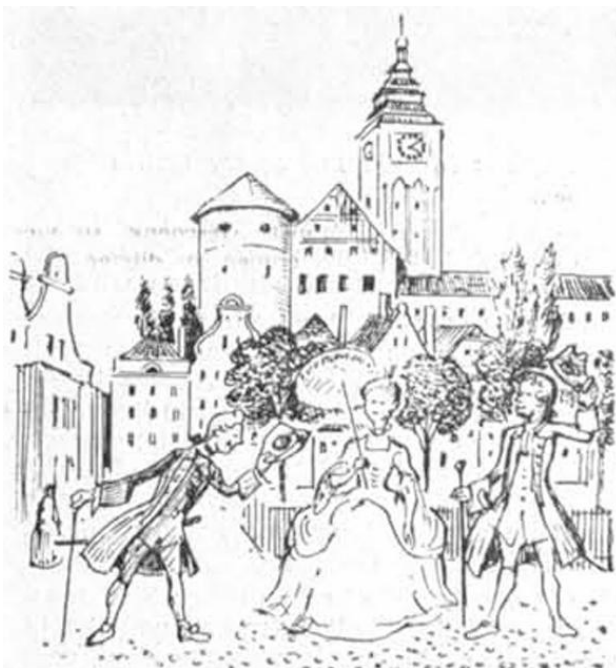
Königsberg zur Zeit der Reifröcke

Die große Pest der Jahre 1708/1709, die viele als eine Strafe Gottes ansahen, dämpfte den Luxus, aber nur vorübergehend. Er lebte bald wieder auf, und zwar besonders bei den Beerdigungen.